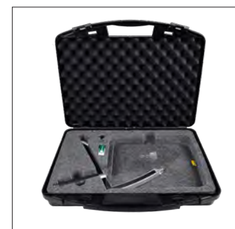
Valise de transport pour miroir parabolique