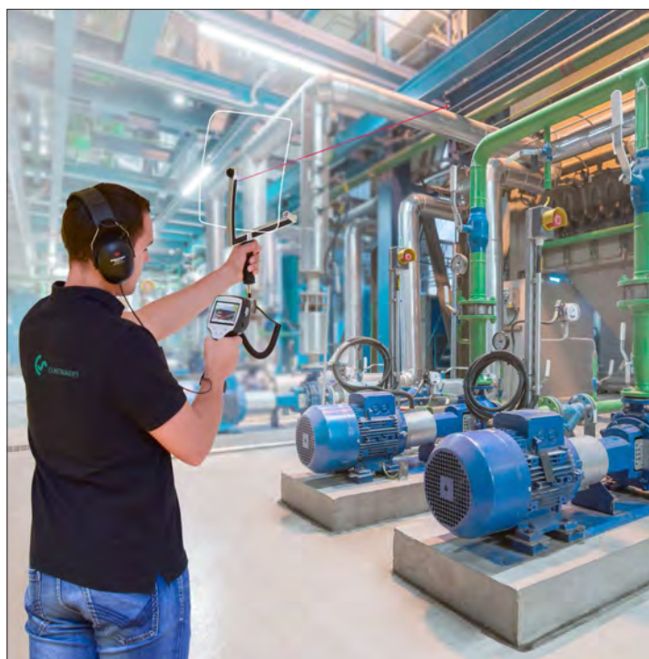
Localisation avec précision des fuites pendant le fonctionnement avec pointeur laser et caméra intégrée

Par concentration des ondes ultrasonores dans le miroir parabolique, même de faibles fuites de 0,8 l/min (environ 8 € par an) peuvent être localisées avec précision ( \pm 15 cm), et à des distances allant jusqu'à 10...15 mètres. La forme du miroir parabolique garantit que seules les ondes ultrasonores de la fuite visée soient analysées. Quant aux bruits parasites, ils sont réduits au minimum.