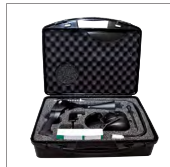
Valise de transport pour LD 500 ou LD 510