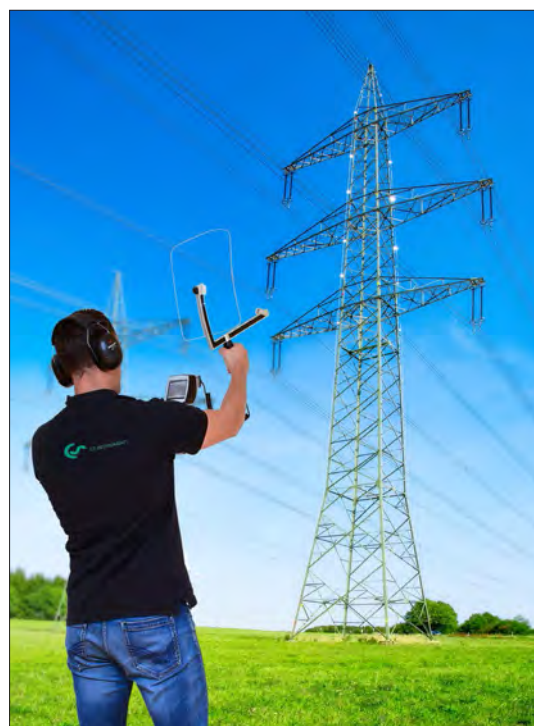
Détection de phénomène de décharge électrique partielle entraînée par l'ionisation appelé «effet Corona» ou «effet couronne» sur les lignes à hautes tensions aériennes.