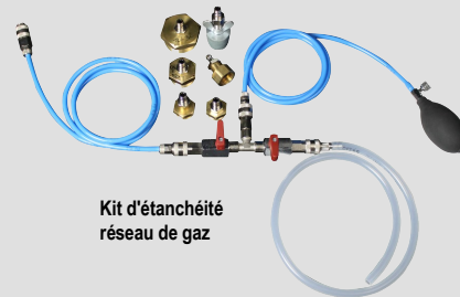
Kit d'étanchéité réseau de gaz

1 Voir la fiche technique des accessoires pour kigaz pour plus de détails