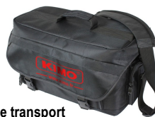
Sacoche de transport